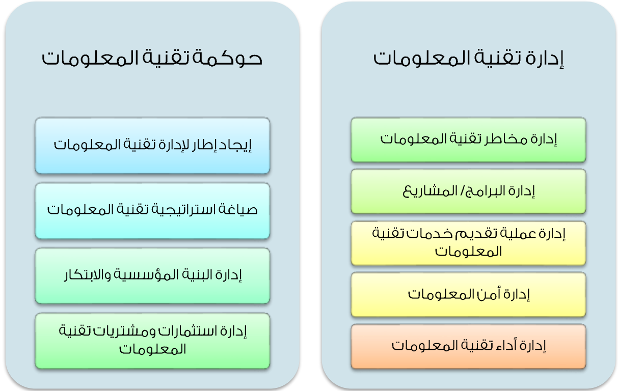
الشكل 2: أولويات إدارة تقنية المعلومات