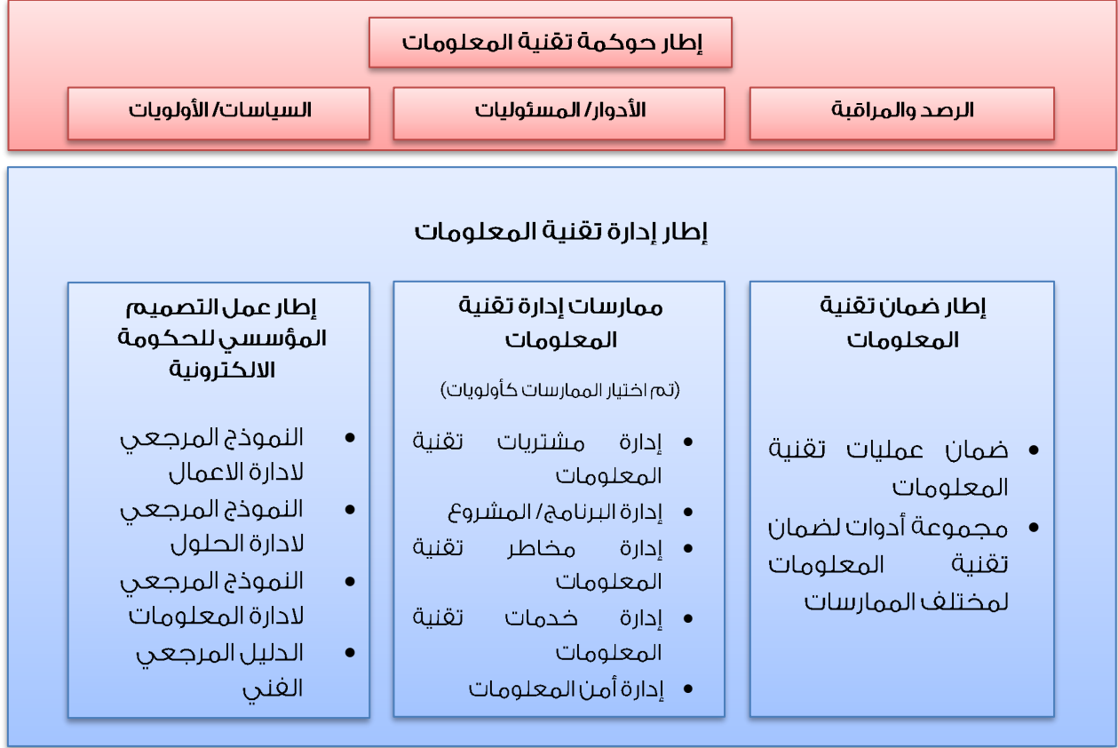
الشكل 1: إطار حوكمة تقنية المعلومات